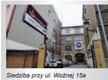
Siedziba przy ul. Woźnej 15a