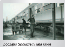
początki Spółdzielni lata 60-te