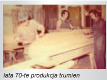
lata 70-te produkcja trumien