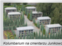
Kolumbarium na cmentarzu Junikowo